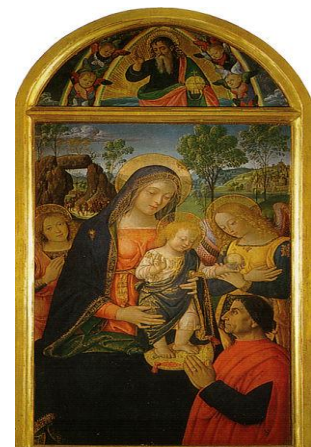
Pinturicchio:Madonna della Pace

l’affresco con Storie di S. Giovanni evangelista dei fratelli Lorenzo e Iacopo Salimbeni; inoltre un polittico di Vittore Crivelli (Madonna e Santi ).