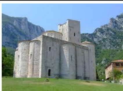
Chiesa di San Vittore alle Chiuse

ore 07:30. Partenza da Roma, piazza Indipendenza (unico punto di incontro) direzione Fabriano, (percorso Km 215- circa 4 ore con soste). All’arrivo, inizio delle visite di Fabriano che prevedono: La Mostra “ da Giotto a Gentile, pittura e scultura a Fabriano fra Due e Trecento presso la Pinacoteca Civica “Bruno Molajoli”. Cattedrale di San Venanzio, Le cappelle giottesche della chiesa di Sant’Agostino e la chiesa di San Domenico (che fanno parte dell’itinerario urbano della mostra). Nel corso delle visite, sosta per uno spuntino libero. Al termine delle visite, registrazione in albergo a Fabriano, Cena e pernottamento.