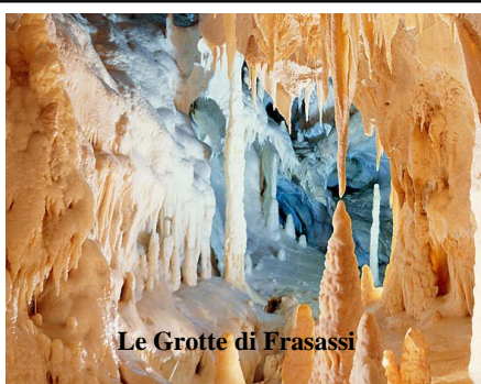
Le Grotte di Frasassi